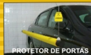
PROTETOR DE PORTAS